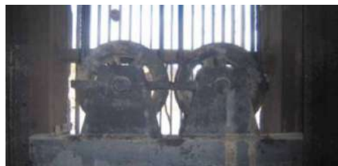
錆による腐食が著しい取水ゲートの開閉装置のようす(取水塔内部)