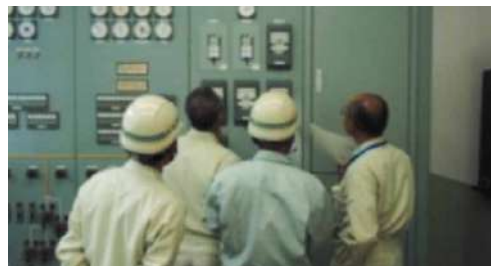
既存の水管理システム

上流から供給される土砂がダムに堆積すると貯水量が減少してしまうため、今後のしゅんせつ(土砂の搬出)に備えて土砂を仮置きするためのストックヤード整備を行います。